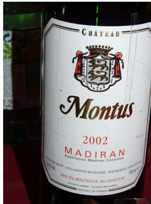
Ch Montus from the South-West rich white as apéritif and with foie gras and lobster and scallop gratin