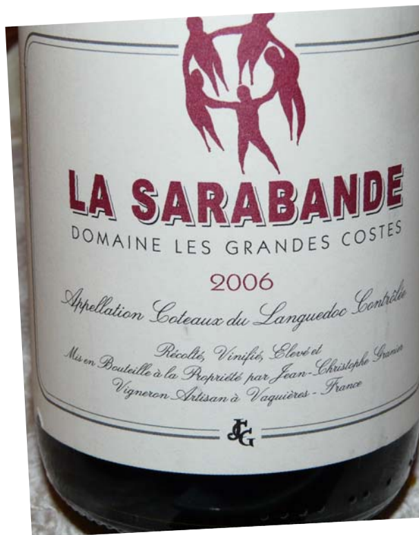
Good red Côteaux du Languedoc with lamb and a real garden of little vegetables and flowers followed by sheep's cheese and this extraordinary mandarin and chocolate dessert